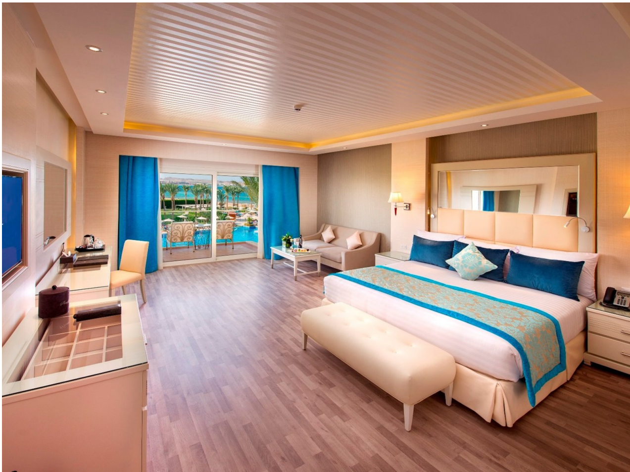
Wohnbeispiel Premium Jacuzzi Suite