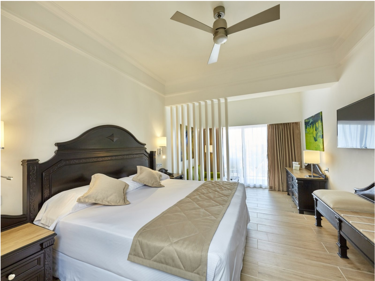
Wohnbeispiel Juniorsuite Standard