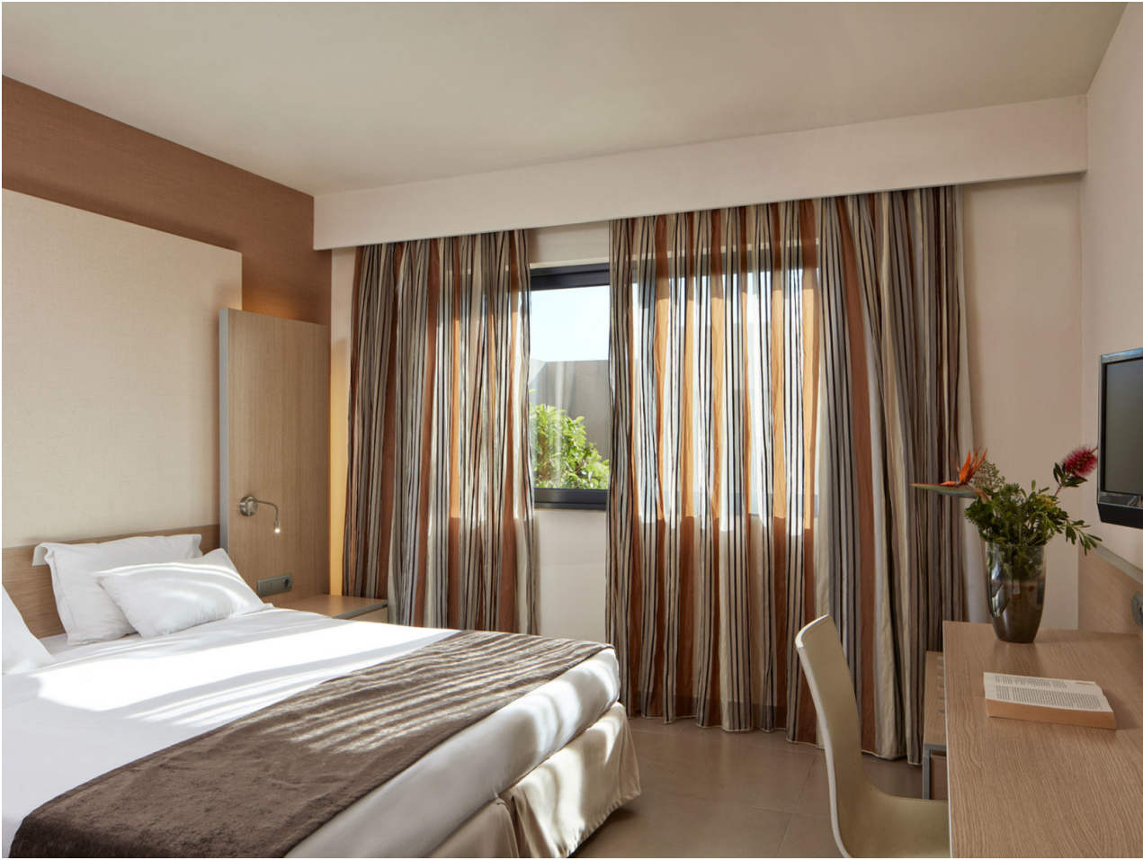
Wohnbeispiel Family room Superior Inland View