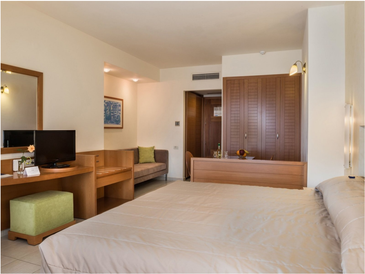
Wohnbeispiel Suite Open Plan