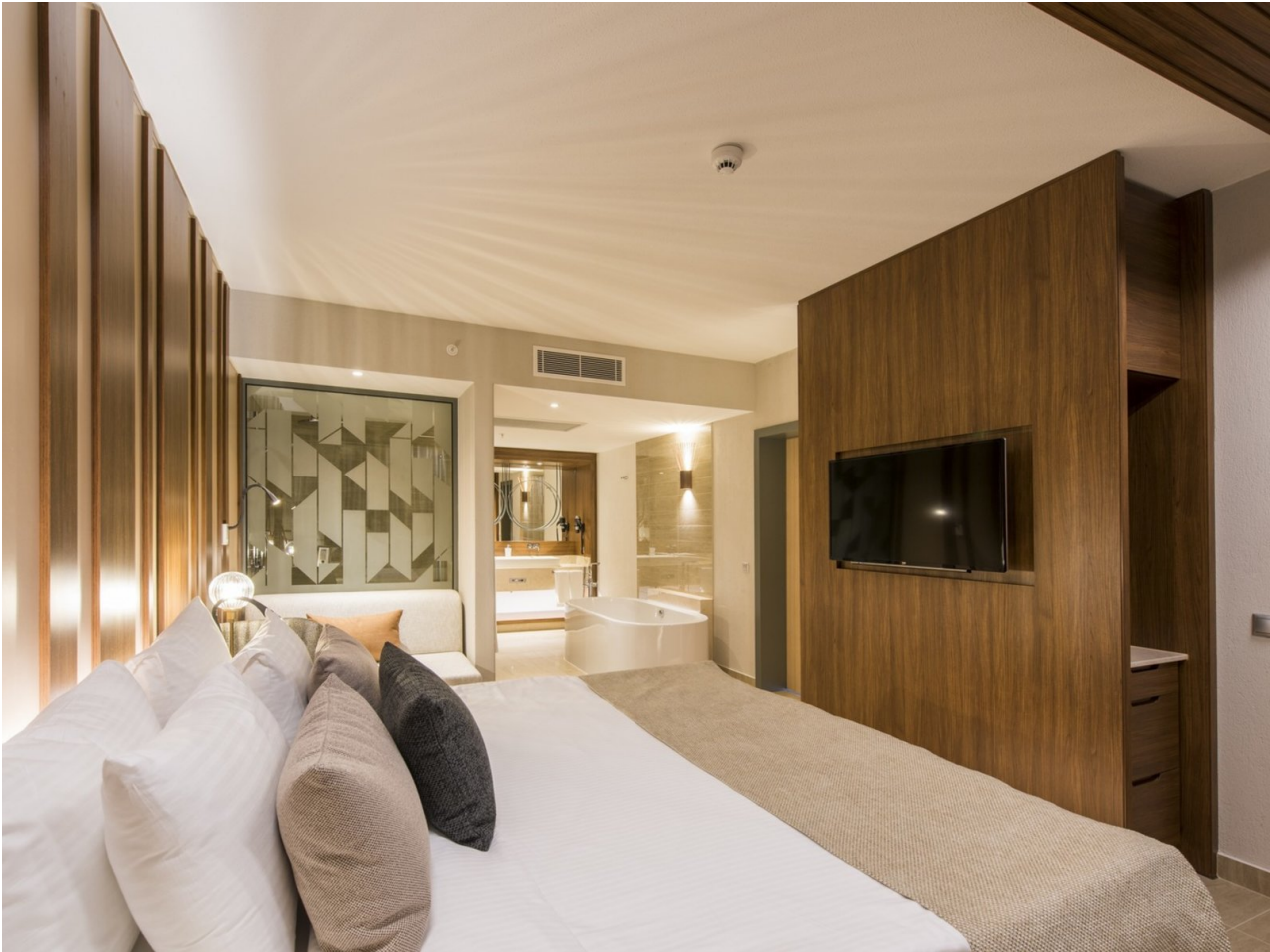
Wohnbeispiel Suite Sea Side