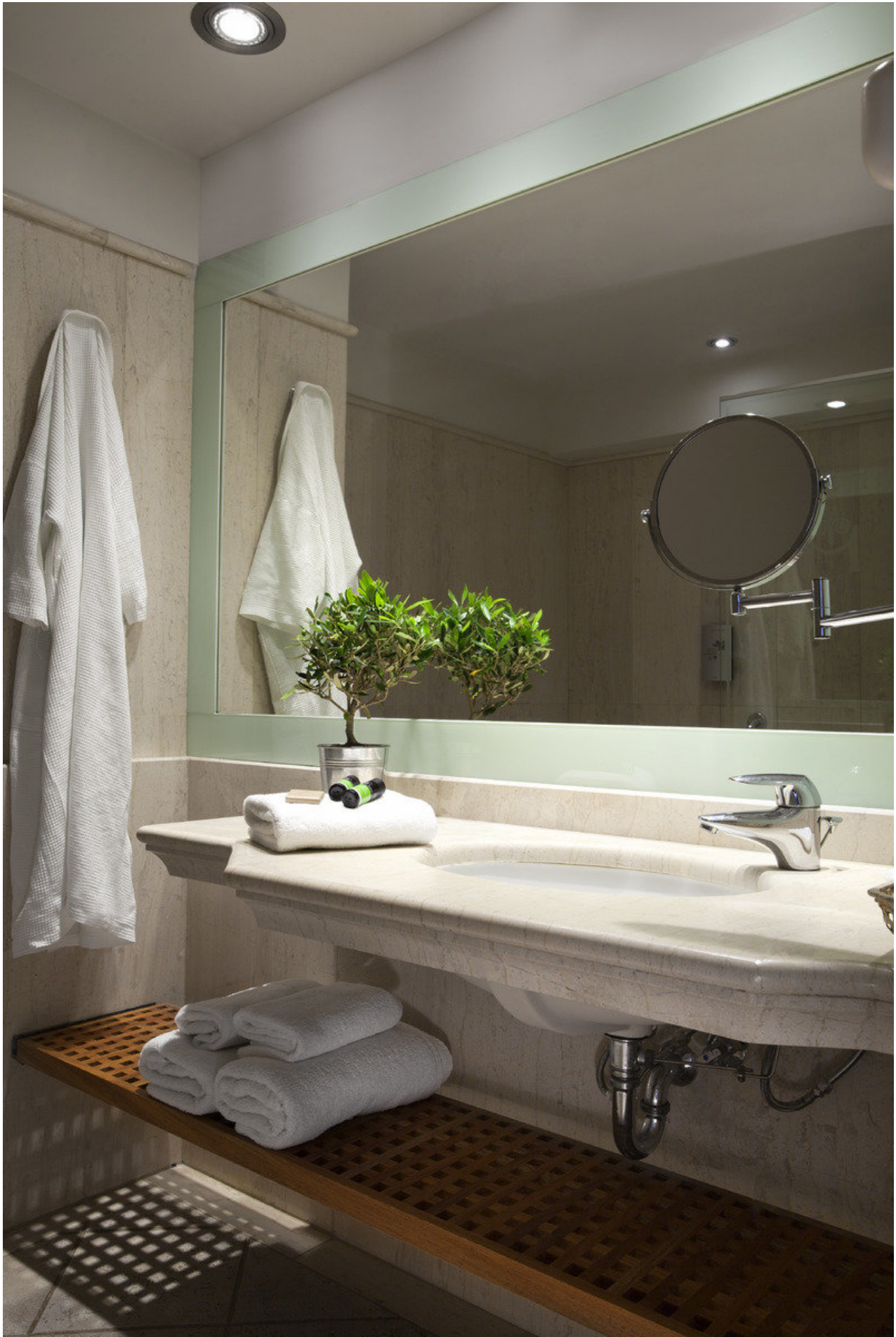
Wohnbeispiel Upper deck sea view room 25-30qm